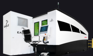
Wycinarka laserowa fiber EAGEL eVision 2040