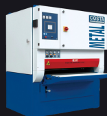
Gratowarka COSTA LEVIGATRICI MD4 CVC 1150