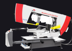
Przecinarka taśmowa BOMAR Workline 610.450 DGH