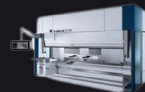
Prasa krawędziowa TruBend_5085