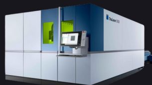
Wycinarka laserowa TRULASER_3030_FIBER