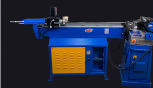
Giętarka trzpieniowa ERCOLINA MG030V2T-A6/H76